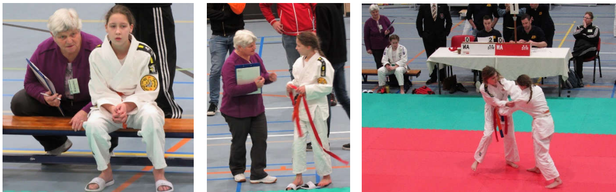
Figuur 4: Wedstrijd coördinator van onze judoclub Ten Shi die judoka coacht tijdens een toernooi

Kleine moeite, groot plezier voor de kinderen die graag deelnemen aan een toernooi!